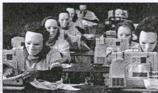
Oxfam-järjestön mielenilmaus Sydneyssä.

Play Fair -kampanja vaatii reilua olympiavaatteisiin