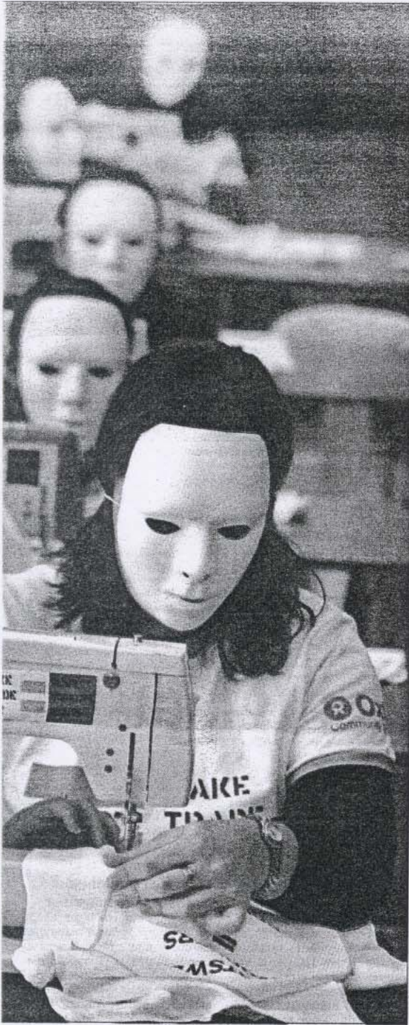
Play Fair -kampanjan edustajat ovat tehneet näyttäviä mediastuntteja eri puolilla maailmaa vaaten huomiota urheiluvaatteita valmistavien työläisten oloihin. Kuvan mielenilmaus tapahtui Sydneyssä, Australiassa Oxfam-järjestön edustajien toimesta.

daarisuuskeskus SASK. Toinen päärahoittajista ja yhteistyökumppaneista on Hollannin keskusammattijärjestö FNV. SASKin lisäksi Suomesta on yhteistyökumppanina hankkeessa ollut Tekstiili- ja vaatetustyöväen liitto Teva, joka fuusioitiin kesäkuusta lähtien Kemianliittoon.