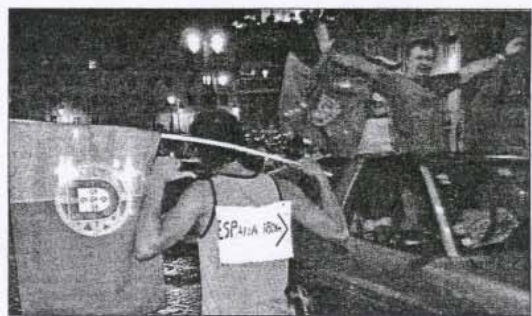
Portugalilaisfanit juhlivat jalkapallon EM-kisojen jatkoapaikansa kuin mestaruutta.